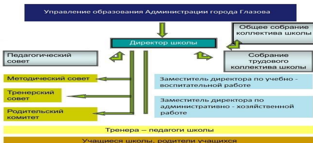
Рис. 2. Структура управления МБОУ ДО «ДЮСШ № 1» г.Глазов